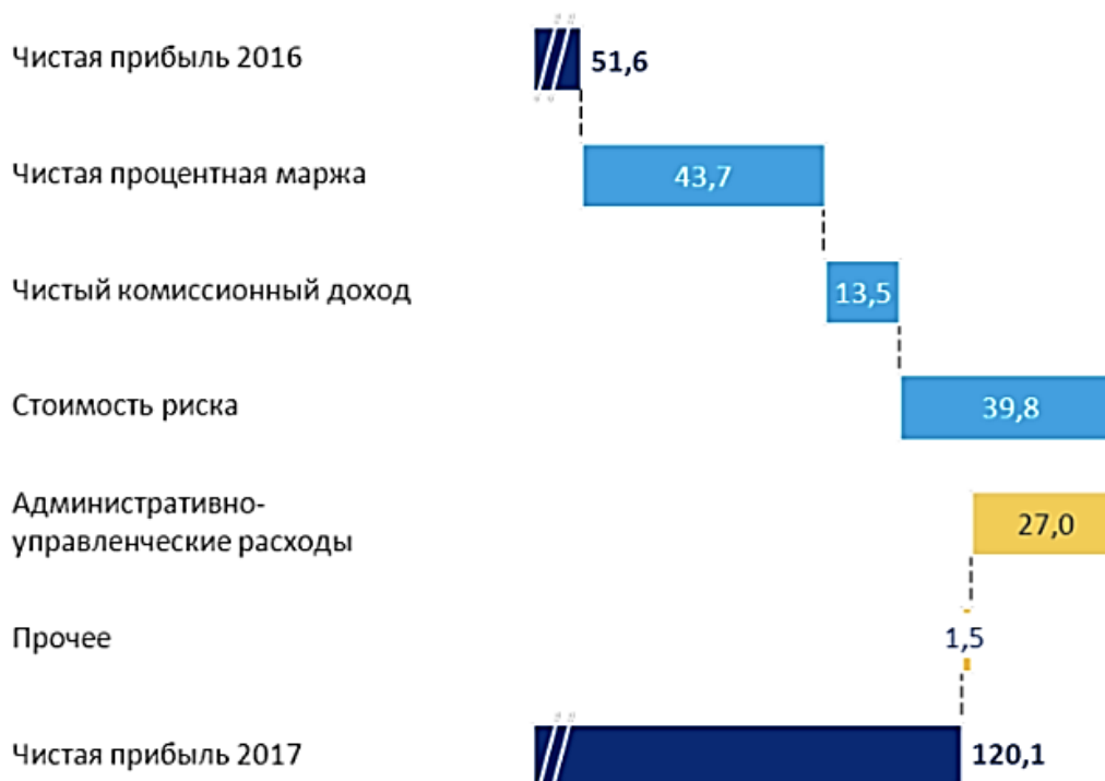
Рис. 1. Факторный анализ чистой прибыли ПАО «ВТБ» за 2017 год

факторный анализ чистой прибыли предприятия. Факторный анализ ПАО «ВТБ» представлен на рисунке 1 [4].