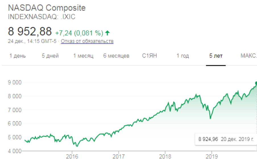
Рис. 2. Изменение индекса NASDAQ

Получаем изменение индекса американской биржи за 5 лет примерно на 85%, что примерно равно изменению индекса Мосбиржи.